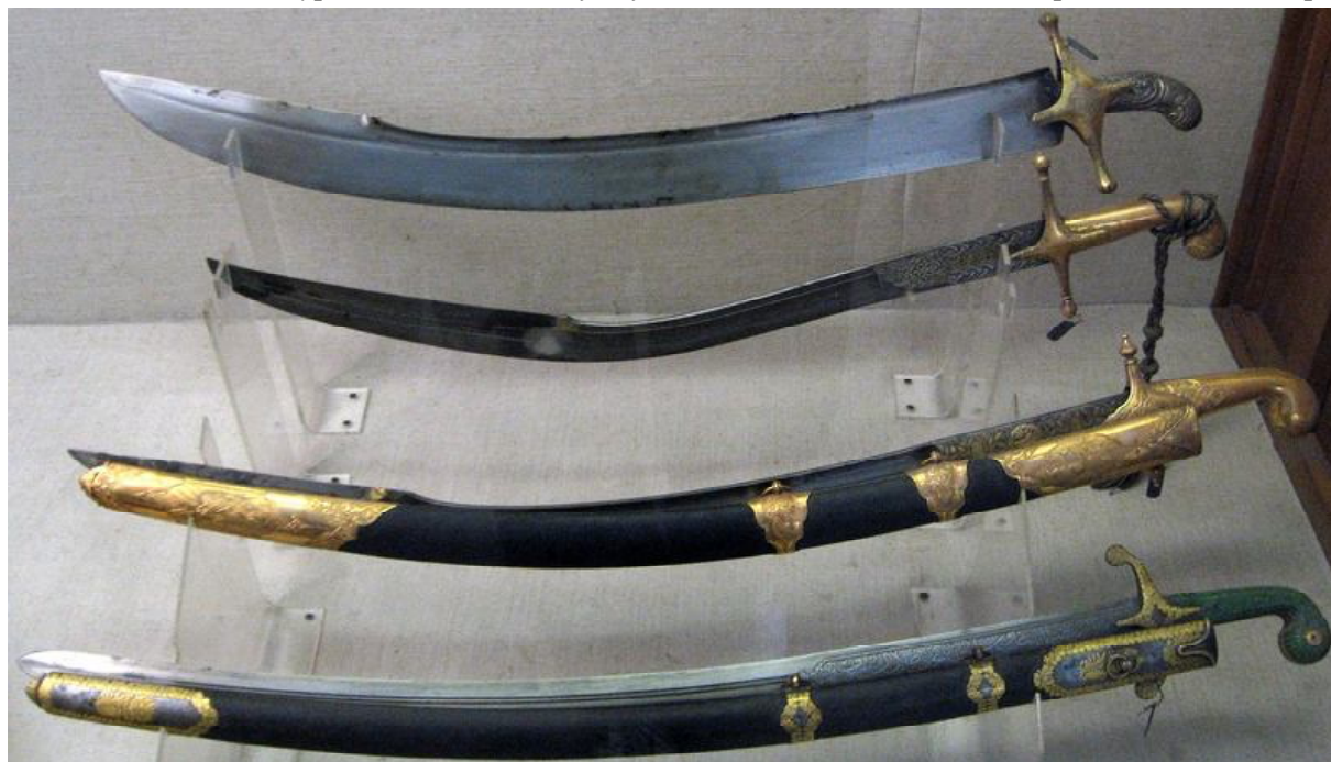
Рис. 2. Шаблі Кримського ханства.