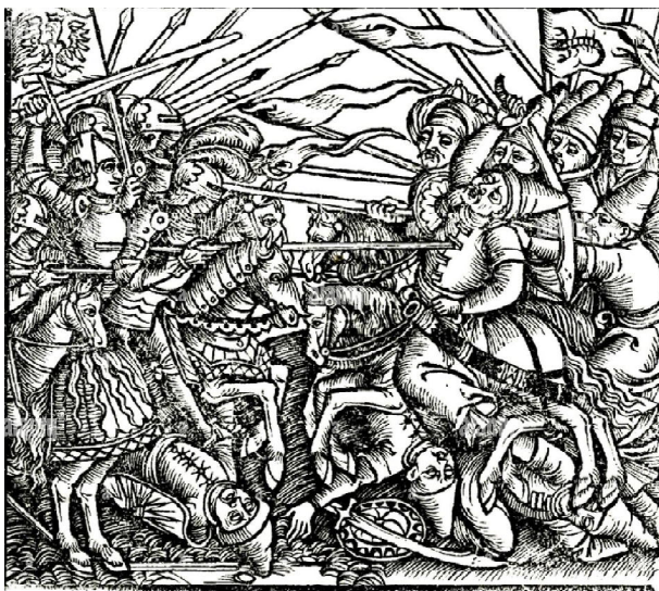
Рис. 1. Битва між поляками і татарами. Титульна сторінка «Опису Сарматії Азійської та Європейської» ( Descriptio Sarmatarum Asianae et Europianae ), 1521.

Більшість тогочасних хроністів зазначали, що кримські татари мали на озброєнні шаблі, але цей вид зброї був менш поширеним ніж луки. Ось що стверджував, зокрема, Сигізмунд Герберштейн: «Їхня зброя – луки та стріли; шабля у них рідкісна» [7]. Проте те, що на озброєнні кримців були шаблі, згадує англійський посол у Московії Д. Флетчер: «Вони [кримські татари], всі виїжджають на конях і не мають при собі нічого, крім лука, сагайдака зі стрілами і кривої шаблі на кшталт турецької» [6]. На думку польського дипломата М. Броневського, татари