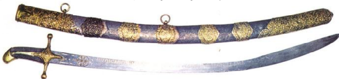
Рис. 5. Ординка XVII ст. Чернігівський обласний історичний музей.